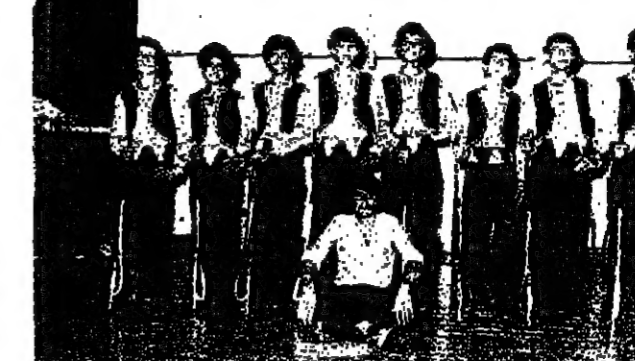
بيت الشيبية في «ابو سنان» على المرتبة الاولى . وقد مرنا تلك واحتفنا معها بهذا الفول .

من التي اوجت الي هذه الرقصة ولدا فقد اعدت كل عضو في الفرقة بارودة خشبية لا تضرها من البرودة الصافية . وقتنا كما لاحظت بحركات عديدة وتشكلات انت الي فوزنا ببارتية الاولى .